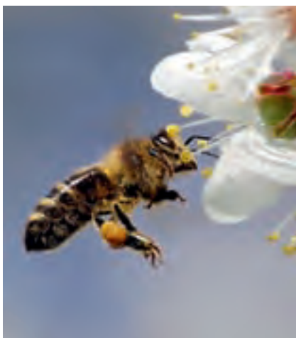
Gut gefülltes Pollenhöschen einer Sammelbiene

Während des Nektartrinkens berührt die Biene immer wieder die Staubgefäße der Blüte. Dabei bleiben viele Pollen in der Körper- und Beinbehaarung hängen. Die eiweißreichen Pollen werden in die „Körbchen“ an den Hinterbeinen