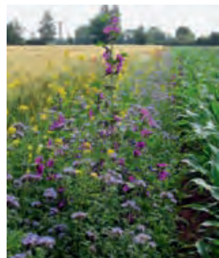
Blühstreifen zwischen zwei Getreidefeldern

Zum Abschluss können die SchülerInnen eine Bienenweide anlegen oder eine Kampagne für Bienenweiden starten (siehe S. 27/28).